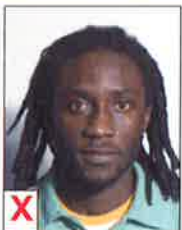
A. Pas uniforme (ombre)