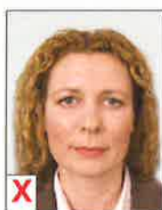
B. Déformation optique