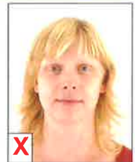
E. Contraste insuffisant