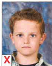
B. Pas uni