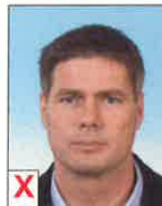
C. Dégradé de couleurs