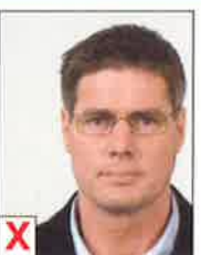
A. Pas centré