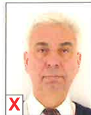
D. Contraste insuffisant