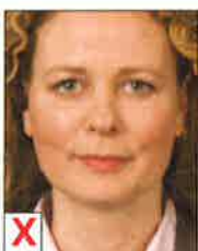
C. Tête trop haute