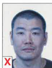
C. Rendu non naturel