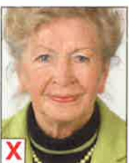
B. Tête trop haute