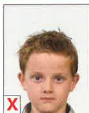
D. Tête trop basse