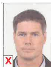
D. Contraste insuffisant