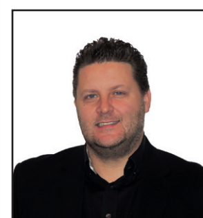
Président du C.P.A.S