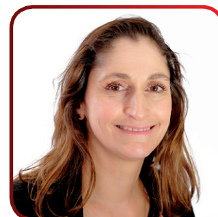
Echevinat de la jeunesse et du bien-être animal

De même, il est interdit d'utiliser un chien pour incommoder ou provoquer la population et porter ainsi atteinte à la sécurité publique, à la commodité de passage et/ou aux relations de bon voisinage.