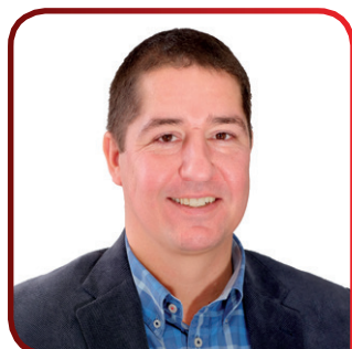
Echevinat des sports et de la culture